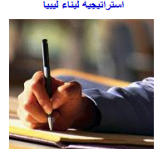
الباتوسي بن عثمان: الحذاء