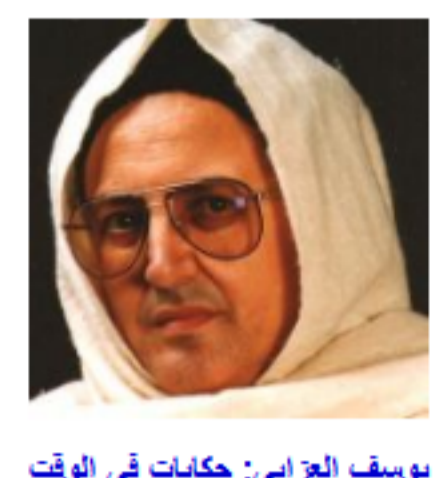
يوسف الزاوي: حكايات في الوقت الضائع