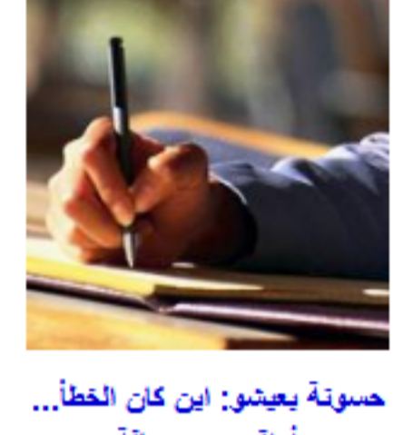
حسونة بعيدون: اين كان الخطأ... أراب من مسافة