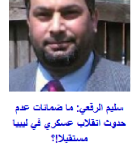
سلم الرقي: ما ضمانات عدم حدوث انقلاب عسكري في ليبيا مستقبلا؟