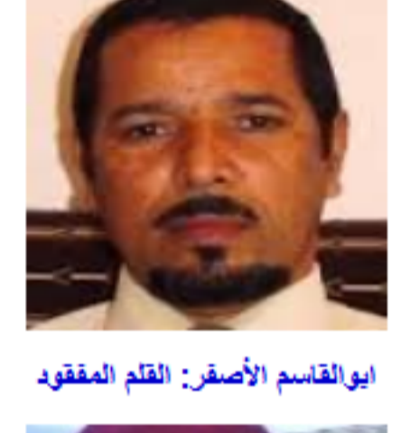
ابوالقاسم الأصفر: القلم المفقود