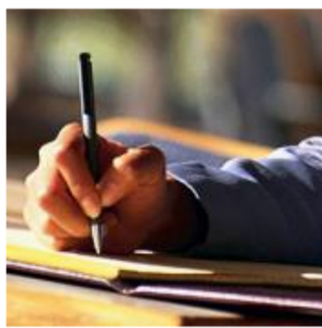
جمال التاجرمني: من رمضان الي رمضان ومسلسل الكاميرا الخفية