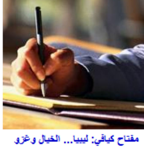
مفتاح كياتي: ليبيا... الخيال وغزو اليهواء