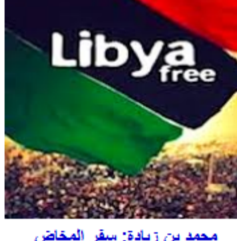
محمد بن زيادة: سفر المخاض