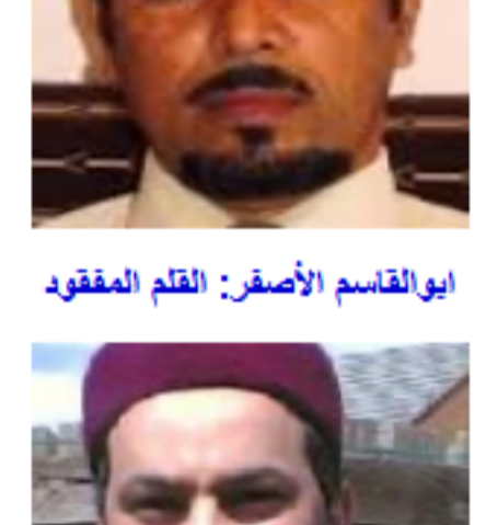
ابوالقاسم الأصفر: القلم المفقود