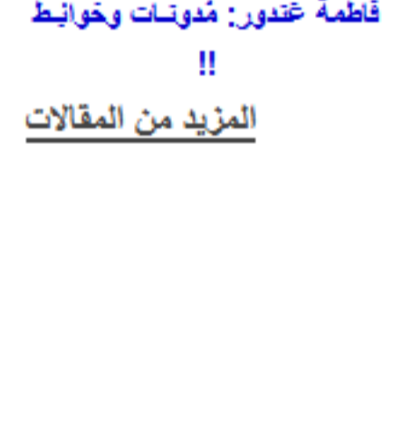
فاطمة اغدور: مُدونات وخوايط !!