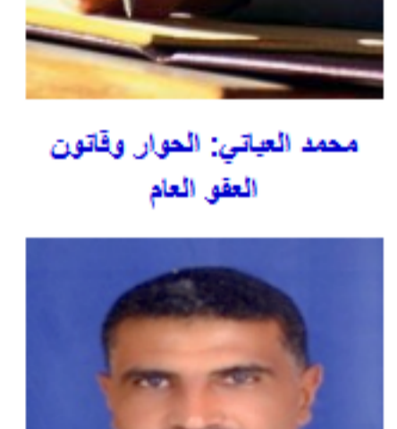
محمد العبادي: الحوار وقتون الطفو العام