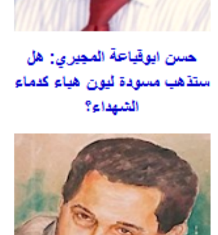
حسن ابوقباة المجري: هل ستذهب مسودة لبون هياء كدماء الشهداء؟