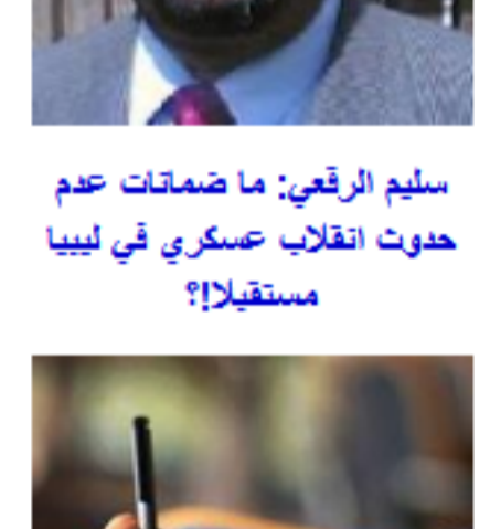
سلم الرقى: ما ضمانات عدم حدوث انقلاب عسكري فى ليبيا مستقبلا؟