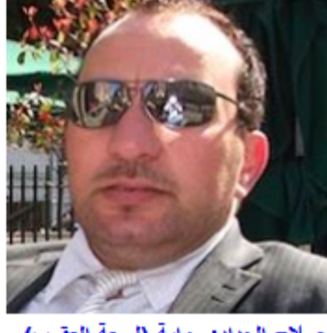
صلاح الحداد: رواية (تسعة المغرب) الحلقة السابعة