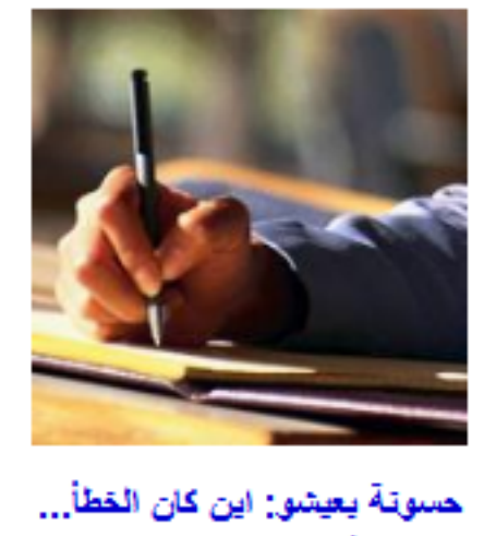
حسونة بعينشو: اين كان الخطأ... أراب من مسافة