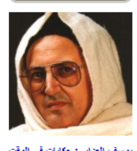
يوسف الزرابي: حكايات في الوقت الضائع