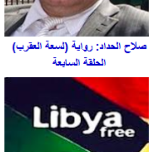
محمد بن زيادة: سفر المخاض