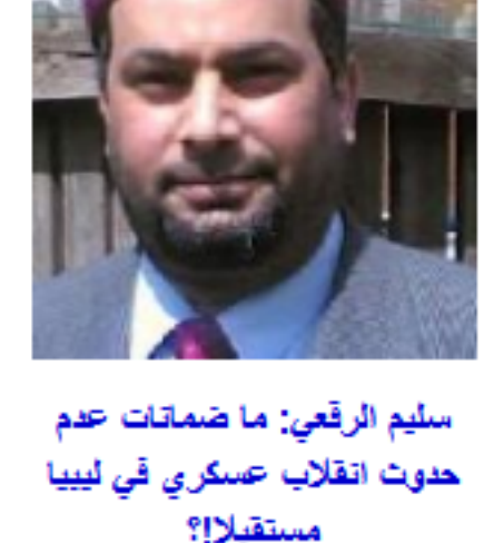
سلم الرقي: ما ضمانات عدم حدوث انقلاب عسكري في ليبيا مستقبلا؟