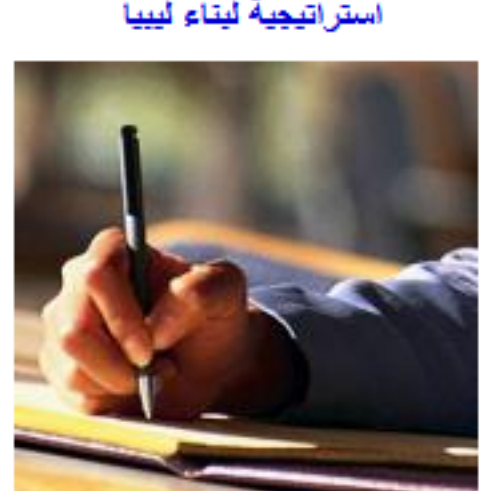
الباتوسي بن حطاء