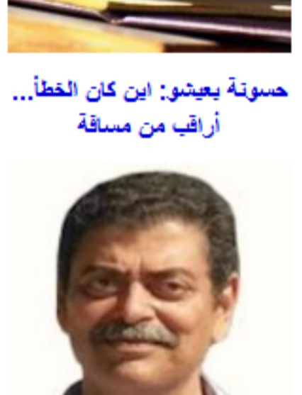
حسونة بعشرو: اين كان الخطأ... أراب من مسافة