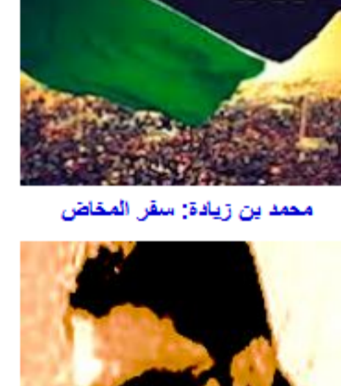
صلاح الحداد: رواية (تسعة المغرب) الحلقة السابعة