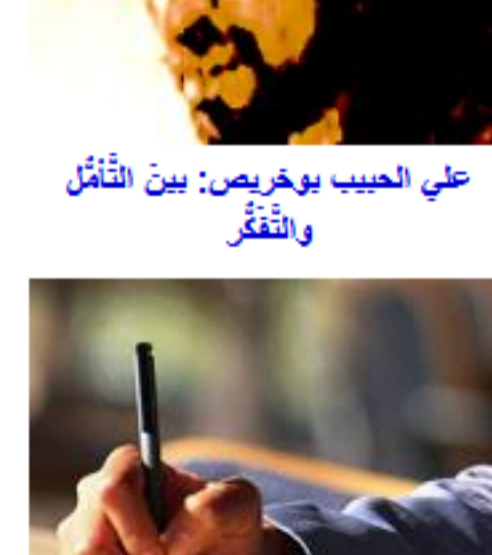
محمد بن زيادة: سفر المخاض