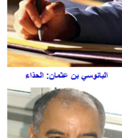
الباتوسي بن عثمان: الحذاء